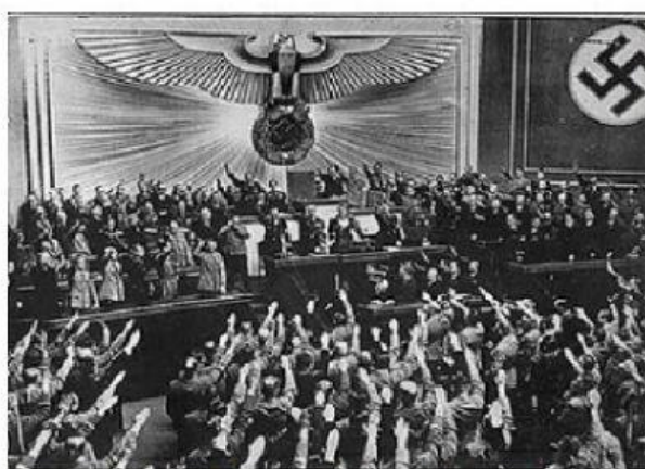
HITLER ACLAMADO CHANCELER DA ALEMANHA – 1933.

O governo da República Parlamentarista, conhecida como República de Weimar era frágil, pois não contava com apoio popular. Isso, ainda num contexto de crise econômica, que levou à desvalorização da moeda alemã. A miséria atingiu a classe trabalhadora, causando profunda insatisfação. Com isso, o nacionalismo ia ganhando adeptos.