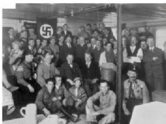
05 DE JANEIRO DE 1919 - FUNDAÇÃO DO PARTIDO NACIONAL SOCIALISTA ALEMÃO, FUTURO PARTIDO NAZISTA.

Embora a Alemanha tivesse começado a se recuperar economicamente, a partir de 1925, a inflação, a dívida externa e o desemprego continuavam altos. Isso facilitou o avanço político dos socialistas e dos comunistas, que mostravam sua força, conseguindo eleger grande número de parlamentares. Também ocorreu o surgimento de partidos que prometiam soluções rápidas para a crise. Um desses era o Partido Nacional Socialista dos Trabalhadores Alemães , fundado em 1919 e que em 1933 se transformaria no Partido Nazista .