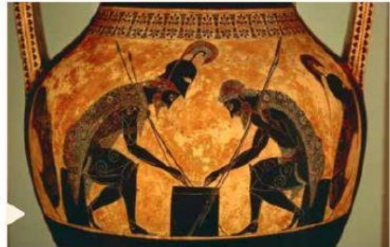
Detalles de antigua cerámica griega

a. ¿Qué información sobre la vida y las costumbres de los antiguos griegos puedes extraer de las imágenes? (4 puntos)