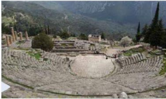
Ruinas de antiguo teatro griego

4. Observa las imágenes y responde las preguntas.