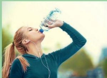
BOIRE DE L'EAU