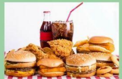
MANGER DU FAST FOOD