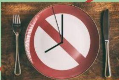
SAUTER DES REPAS