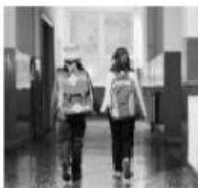
Le moment de mon entrée en 1 re primaire

2. Numérote ces moments de vie dans l'ordre chronologique.