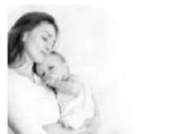
Le moment de ma naissance