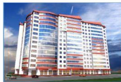
3 block of flats