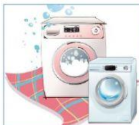
5 washing machines