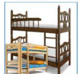
7 bunk bed