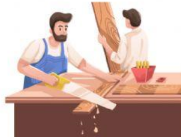
TUKANG KAYU PEMBUAT MEJA