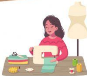
TUKANG JAHIT/PEMBUAT BAJU