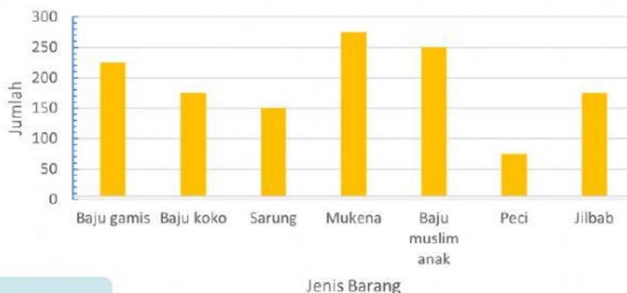
Data penjualan barang selama 1 bulan di toko "Serba Murah"

Berikut adalah data penjualan di toko baju "Serba Murah" milik Bu Rita sebulan menjelang Ramadhan.