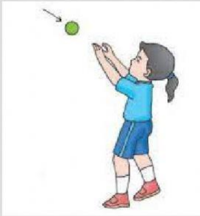
Bola di lempar