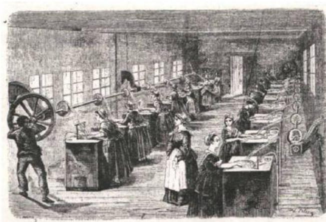
donne che lavorano in una filanda, la fab- brica per la filatura