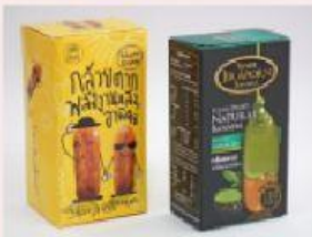
เปลี่ยนบรรจุภัณฑ์ให้สวยสะดุดตา

เพื่อให้ผลิตภัณฑ์หรือการบริการมีเอกลักษณ์แตกต่างจากของเดิม