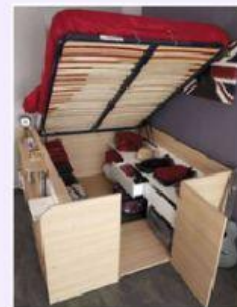
พัฒนาเตียงนอนให้สามารถพับเก็บได้ เพิ่มพื้นที่เก็บของ