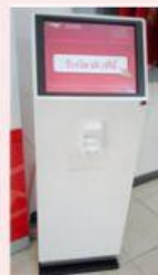
ตู้กดบัตรคิวเข้ารับบริการ