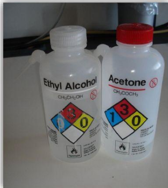
Gambar 1. Botol berisi Etanol dan Aseton