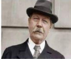
Arthur Conan Doyle

La aventura en un escándalo de bohemia – el sabueso de los Baskerville