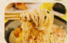
Mie Ayam Pangsit Bakso