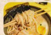
Bakso Pangsit Goreng