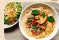
Mie Ayam Bakso