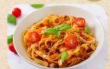
Mie Ayam Pangsit