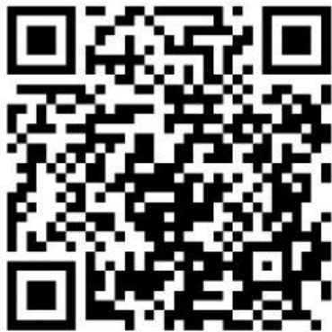
E-modul ciri-ciri bakteri

Nama bakteri sendiri berasal dari bahasa Yunani “bacterion” yang memiliki arti batang kecil. Bakteri adalah organisme paling banyak dan paling berkelebihan dari semua organisme yang ada di bumi. Meskipun memiliki ukuran yang sangat kecil, dan hanya bisa dilihat dengan bantuan mikroskop.