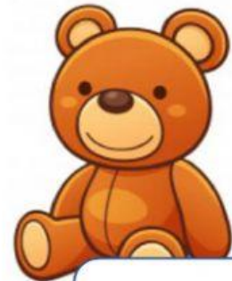
A TEDDY BEAR