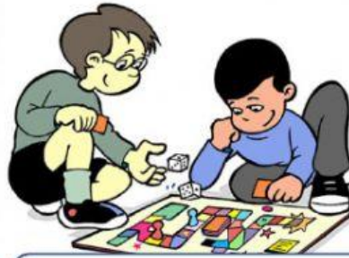
A BOARD GAME