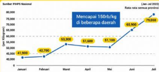
Perkembangan Harga Cabai Merah