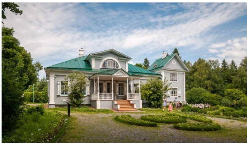
Крыша Крыльцо Терраса Флигель Эркер