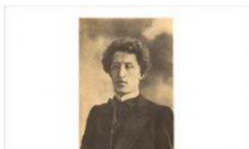
Александр Александрович Блок