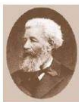
Андрей Николаевич Бекетов