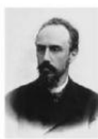
Александр Львович Блок