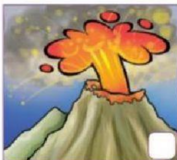
Erupción de un volcán

17. Marca los riesgos naturales que podrían afectar a nuestro país Ecuador.