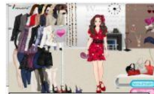
VESTIR A LA MODA