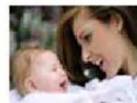
DERECHO A LA VIDA