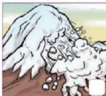
Avalancha de nieve