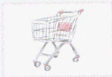
a zum Supermarkt gehen.