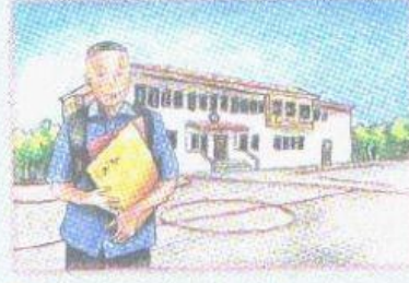
c vor der Schule warten.

Jetzt hörst du die erste Nachricht am Telefon.