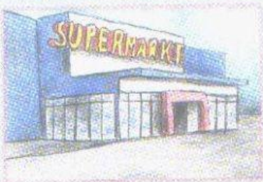
a im Supermarkt.