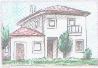
b zu Hause.