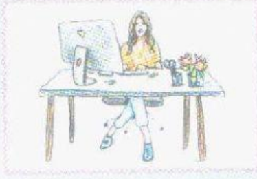
c in der Arbeit.