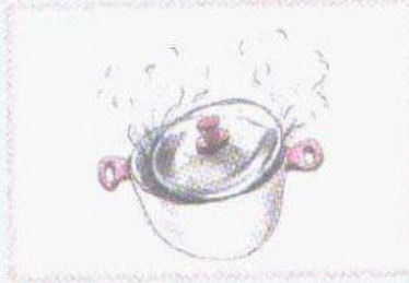
b das Essen kochen.