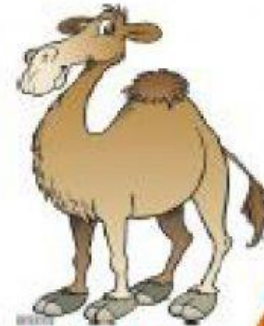
luò tuo 骆驼