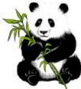
xióng māo 熊猫