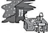
b zu Hause.