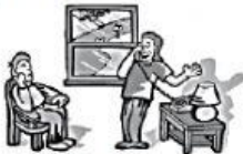
a bei einem Freund.