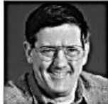
c seinen Vater