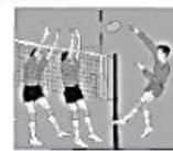
b In den Sportverein.