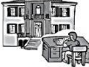
c in der Schule.

Jetzt hörst du die zweite Nachricht am Telefon.