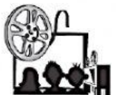
c Ins Kino.