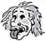
a In Physik.