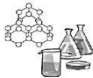
c In Chemie.