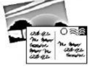
c eine Postkarte.