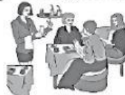
a In ein Café.