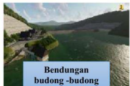
Bendungan budong -budong