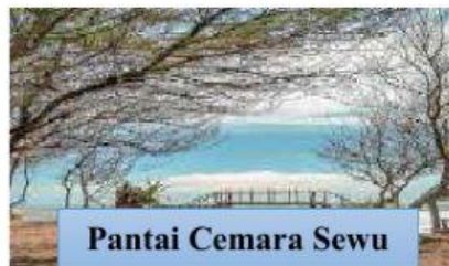
Pantai Cemara Sewu