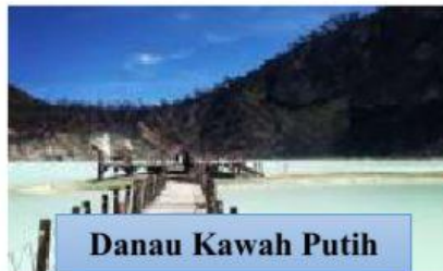
Danau Kawah Putih