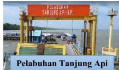
Pelabuhan Tanjung Api