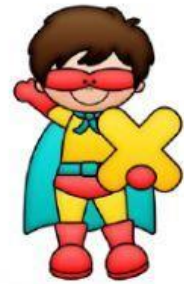
TABLA DEL 8