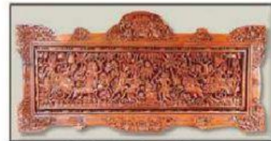
Gambar ukiran kayu dari Jepora