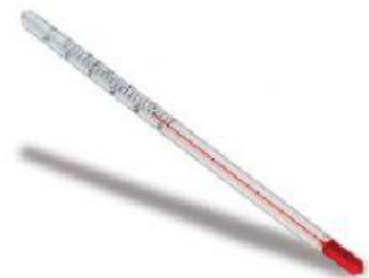
Gambar 2. Termometer Laboratorium

Bentuknya panjang dengan skala dari -10^{\circ}\text{C} sampai 110^{\circ}\text{C} menggunakan raksa, atau alkohol.