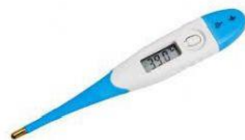
Gambar 3. Termometer Suhu Badan

Termometer ini digunakan untuk mengukur suhu badan manusia. Skala yang ditulis antara 35^{\circ}\text{C} dan 42^{\circ}\text{C} .