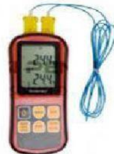
Gambar 5. Termometer termokopel

Termometer yang terdiri dari dua jenis logam yang dihubungkan dan membentuk rangkai tertutup. Pengukuran suhu berdasarkan pada perubahan besarnya aliran listrik pada kawat.