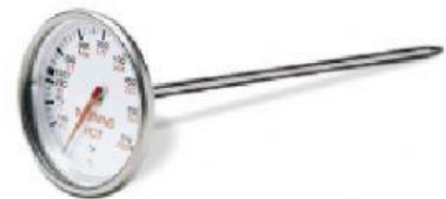
Gambar 4. Termometer bimetal

Termometer bimetal merupakan termometer yang menggunakan logam sebagai bahan untuk menunjukkan adanya perubahan suhu dengan prinsip logam akan memuai jika dipanaskan dan menyusut jika didinginkan.