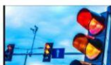
Gambar disamping merupakan salah satu contoh pemanfaatan rangkaian listrik .....