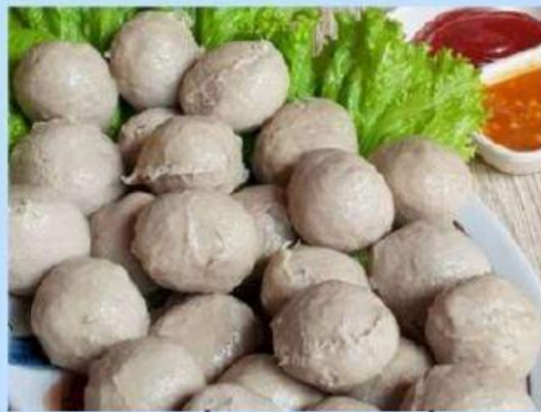
Gambar 2. Bakso