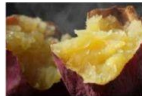
Perubahan sifat karena .....