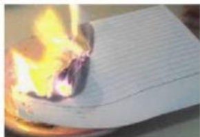
Perubahan sifat karena pembakaran

Tuliskanlah apa yang menyebabkan benda tersebut mengalami perubahan sifat!