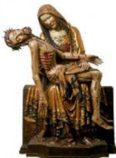
Pietà z Lubiąża Pietà z Lubiąża, ok. 1370, polichromia na drewnie, Muzeum Narodowe w Warszawie, licencja: CC 0 1.0.

9. Przyjrzyj się XVI-wiecznej Piecie z Lubiąża zamieszczonej na początku tej części lekcji. Wskaż podobieństwa między rzeźbą a Lamentem świętokrzyskim. Zauważ sposoby przedstawiania emocji.