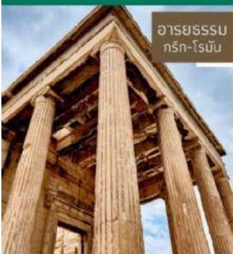
อารยธรรมกรีก-โรมัน

7.นครรัฐเอเธนของอารยธรรมกรีกได้รับยกย่องว่าเป็นต้นแบบการ