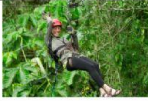
Go zip lining