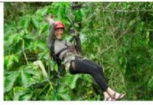
Go zip lining