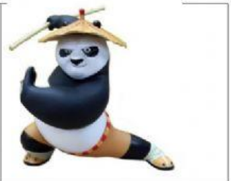
Do kung fu