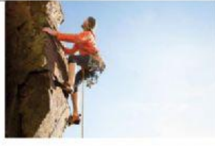
Go rock climbing