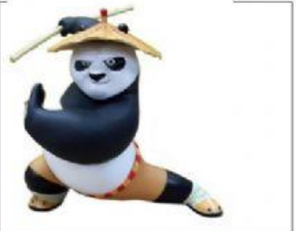
Do kung fu