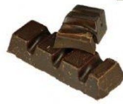
Fig.1 Chocolat noir

Le chocolat est principalement composé de lait, de cacao, de sucre et de beurre de cacao. Le chocolat noir contient une grande quantité de cacao alors que le chocolat blanc ne contient aucune trace de cacao. Beaucoup de gens, y compris les jeunes enfants, aiment le chocolat blanc car il fond dans la bouche.