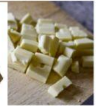
Fig.2 Chocolat blanc

Le document-1 représente une expérience réalisée par un étudiant pour savoir lequel du chocolat noir ou blanc fond plus rapidement.