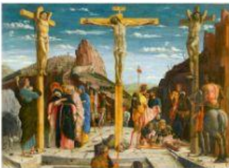
Crucificação de Jesus