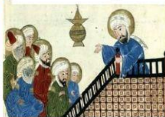
Maomé e seus seguidores