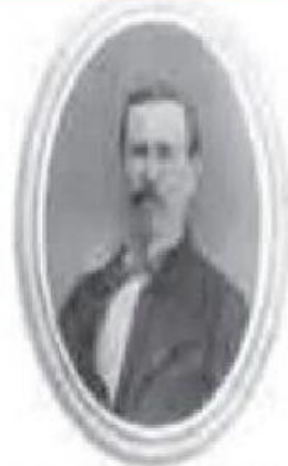
Presidente Félix María Zuloaga (conservador)