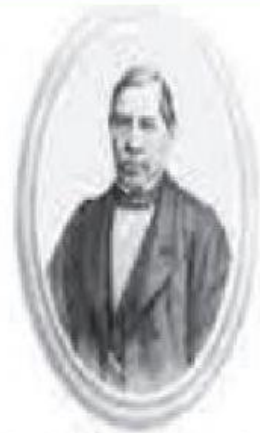
Presidente Benito Juárez (liberal)