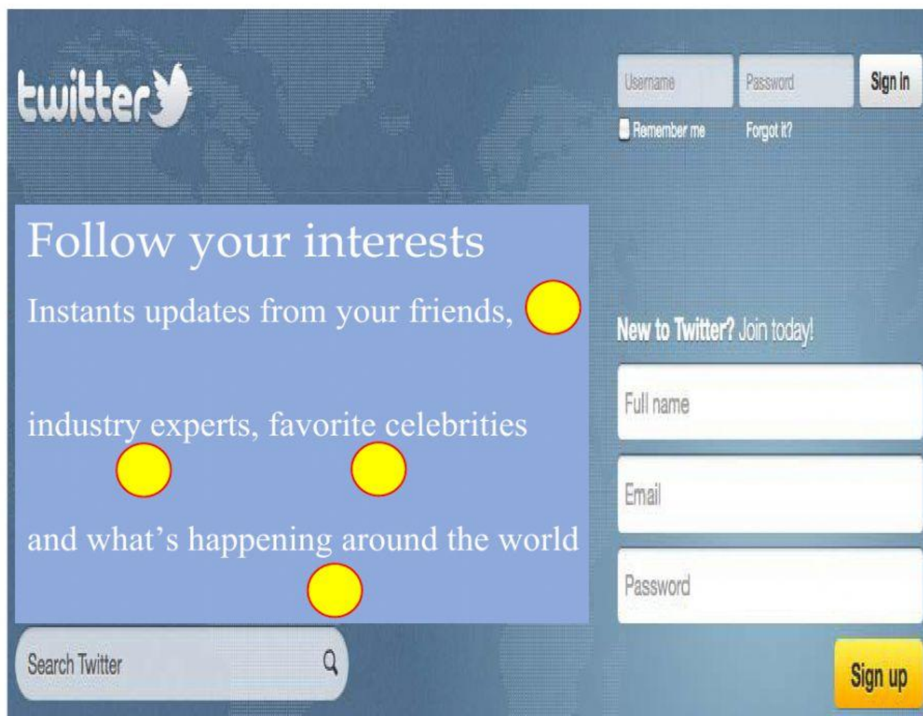
IMAGEM PARA A QUESTÃO 2

2) Segundo o site da ferramenta chamada Twitter, usando esse site, só não é possível :