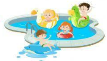
à la piscine

8. Elles adorent les films. Le week-end, elles _____