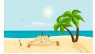
à la plage