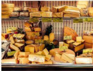
à la fromagerie