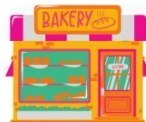
à la boulangerie