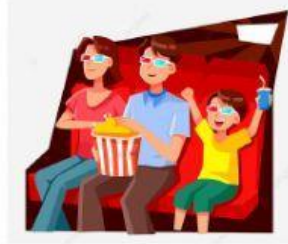
à la plage