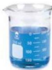
ข. บีกเกอร์ ขนาด 250 ลบ.ซม.