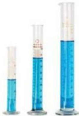
ก. กระบอกตวง ขนาด 50, 100 และ 200 ลบ.ซม.

3. ถ้าต้องการตวงของเหลวปริมาตร 100 ลูกบาศก์เซนติเมตร จะเลือกใช้ อุปกรณ์ใดจึงจะเหมาะสมและตวงที่ครั้ง เพราะเหตุใด