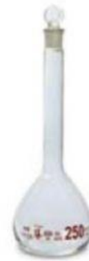
ค. ขวดปริมาตร ขนาด 250 ลบ.ซม.