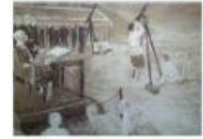
กล้องสองทางไกล