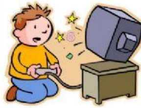
play video games