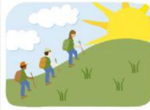
walk up a hill