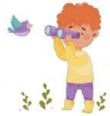
look at birds