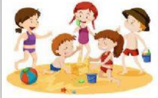
play on the sand