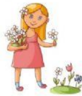
pick some flowers