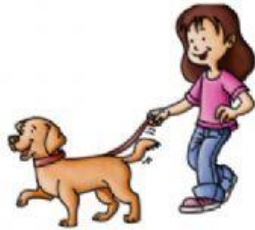
walk the dog