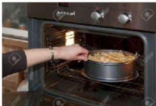
der B _____