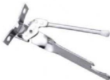
der D _____