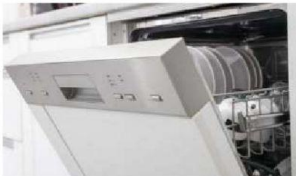
die S _____