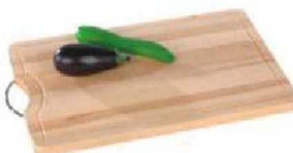
das S _____