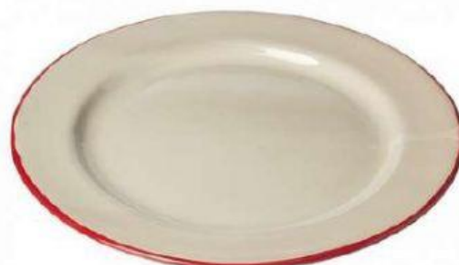
der T _____