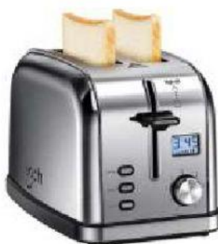
der T _____