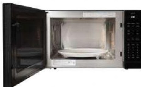
die M _____