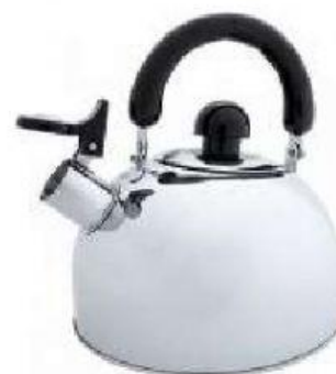
der W _____

das Schneidbrett die Spülmaschine der Dosenöffner die Mikrowelle der Wasserkessel der Toaster der Backofen der Teller