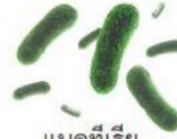
แตงที่เรีย